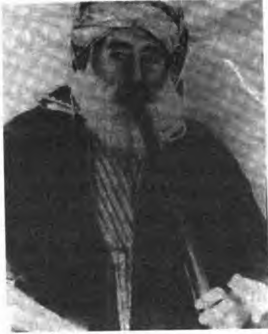
حه ماغای کۆیه

یه کیک له پیاو ماقولان و گه و ره پیاوو ده و له مه نده ده ست و دل ئاوا لاکانی شاری کۆیه یه، که به نا نخۆشی و میوانکر و پیاوه تی زۆر به ناوبانگ بووه و ئیستاش هه ر له بیـر نه چۆته وه بو هه مو خه لکی هه ریمه که بو ته و یردی زمان و مه ته ل له کورده واری دا.